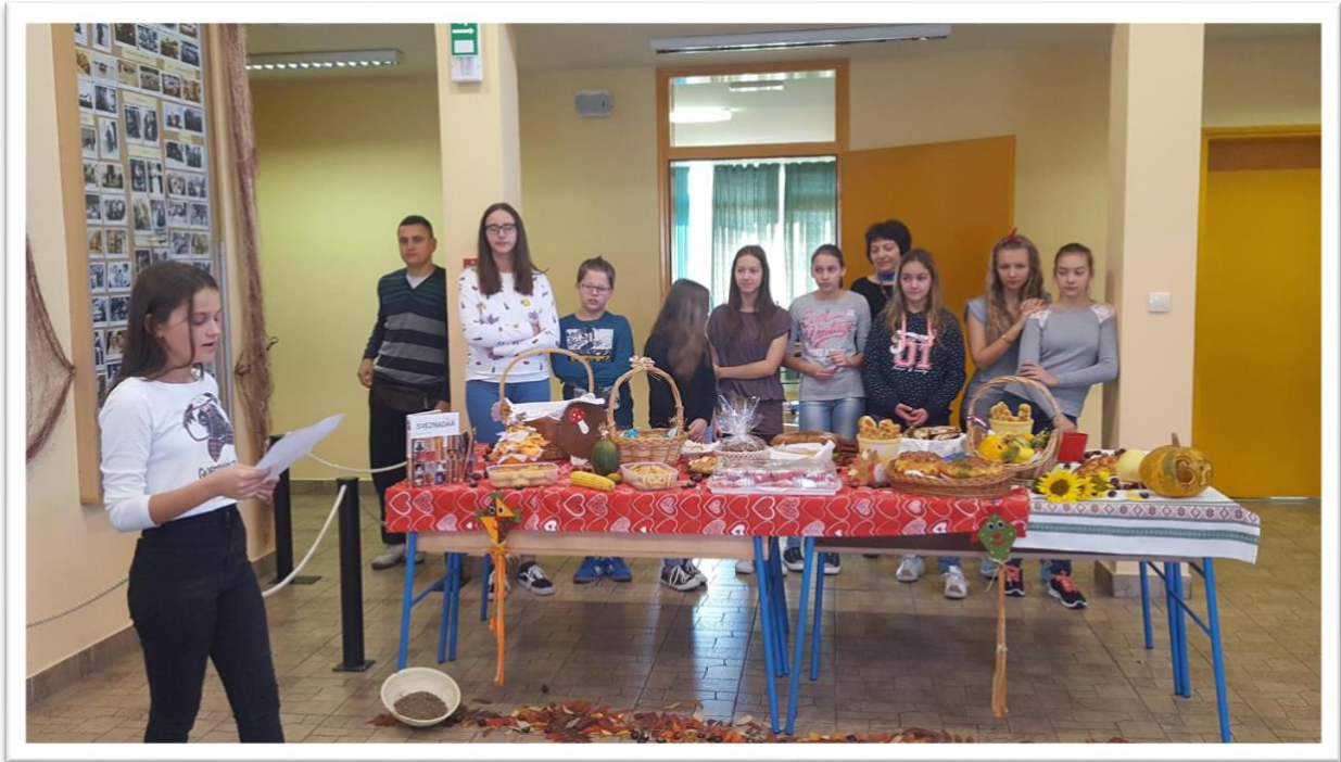
Dan kruha 2017.