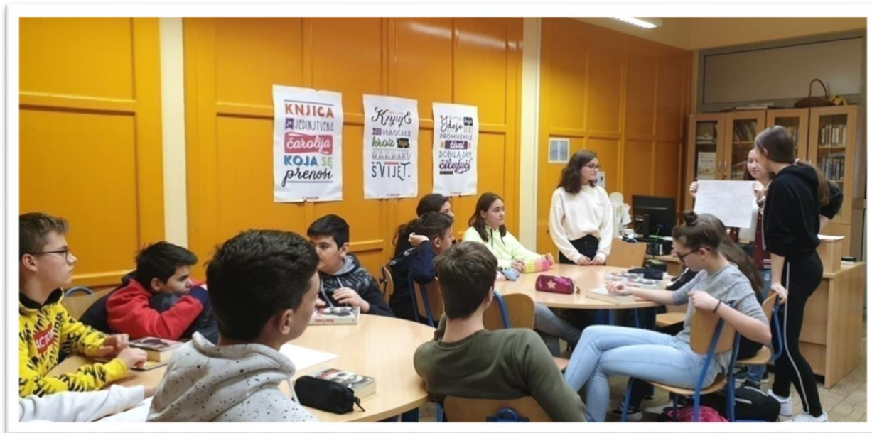
... u školskoj knjižnici ...