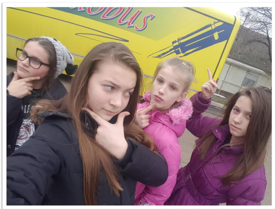
... posjet Bibliobusa