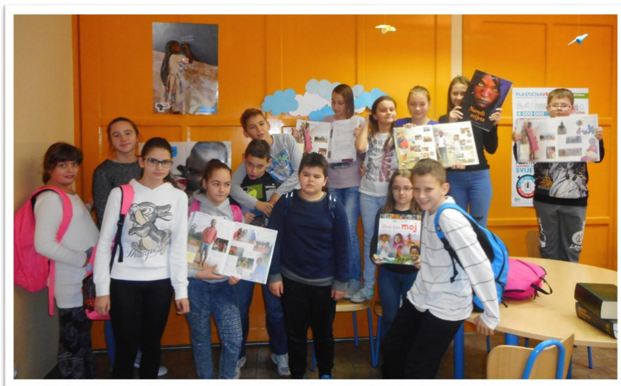
... humanitarna akcija „Škole za Afriku“ 2016.