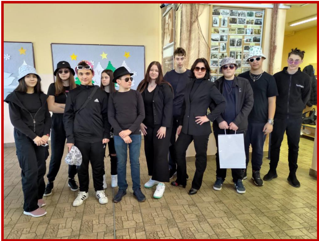
Mafija - maškare 2023.