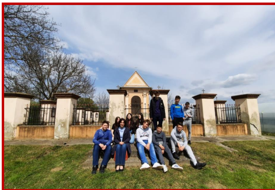
Cvjetnica - kalvarija Čakovci 2022.