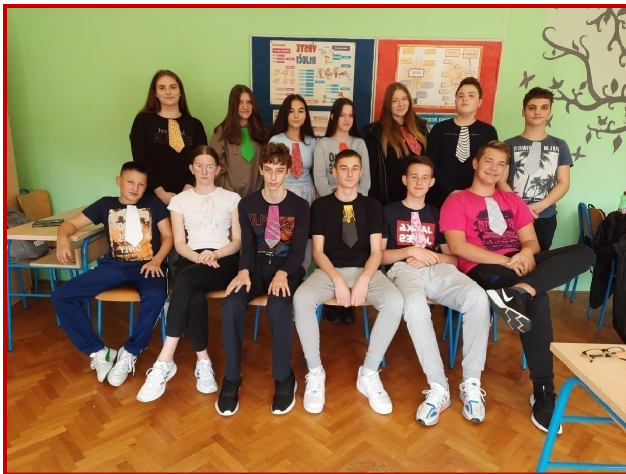
Dan kravate 2022.