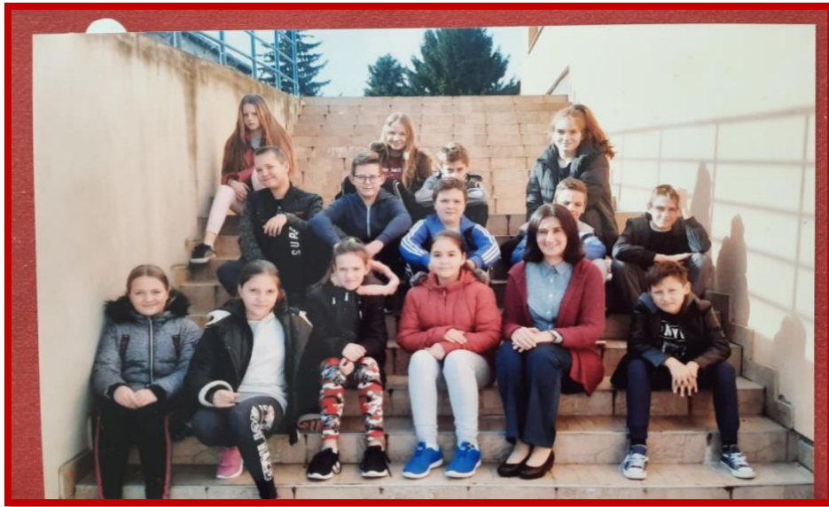
5. razred 2019.