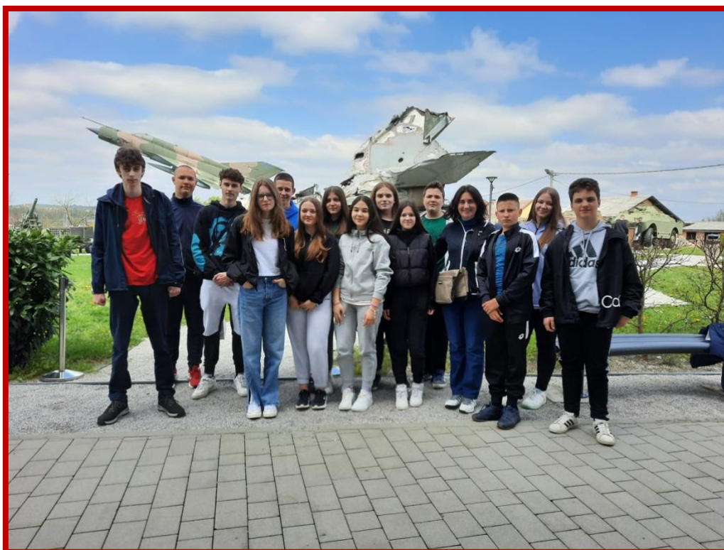
Muzej Domovinskog rata Karlovac 2023.