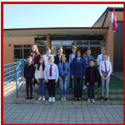
Dan kravate 2019.