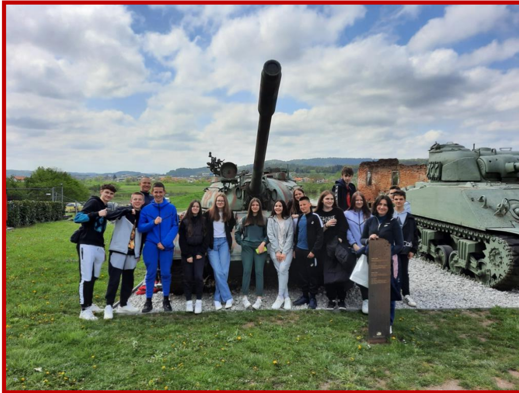
Muzej Domovinskog rata Karlovac 2023.