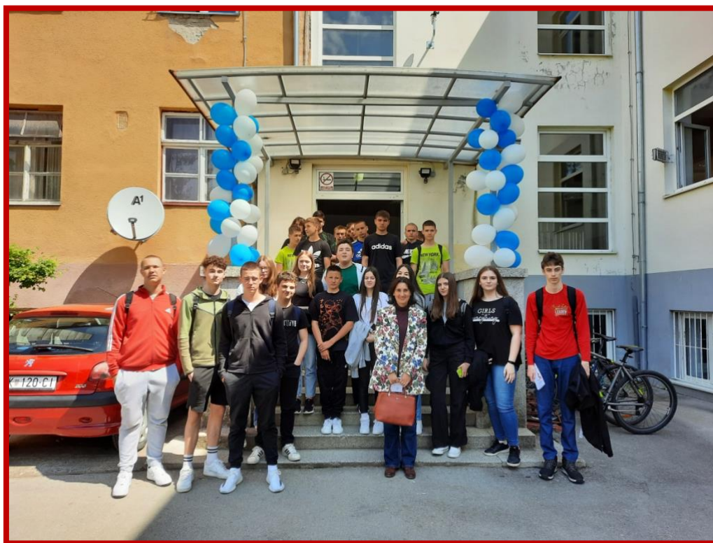
Otvorena vrata srednjih strukovnih škola u Vinkovcima 2023.