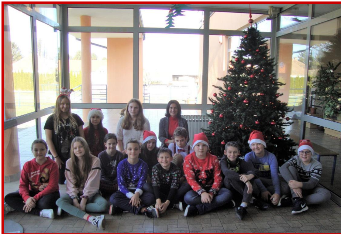
Božić 2019. - 5.razred