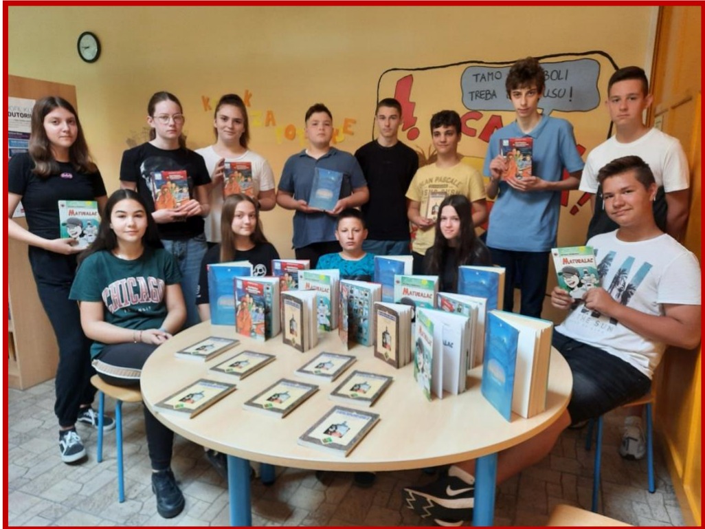
Najčitanije lektire 2022.