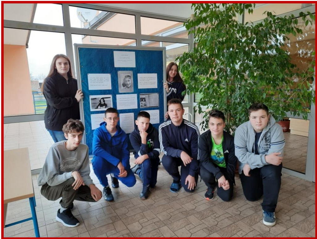
Međunarodni dan sjećanja na žrtve HOLOKAUSTA 27.1.2023. „Dnevnik Anne Frank“