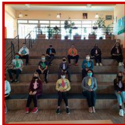
Dan kravate 2020.