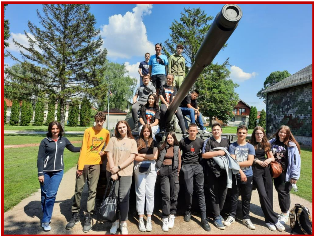
MCDR Vukovar 2023.