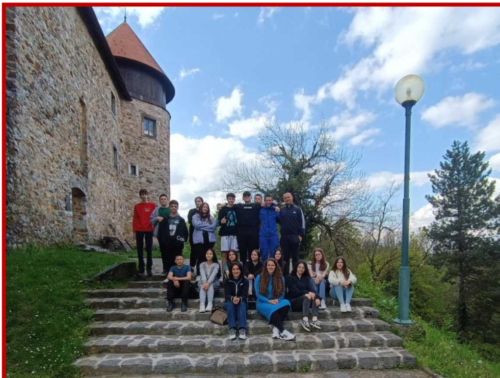
Stari grad Dubovac - Karlovac 2023.